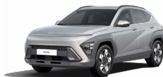
Shimmering Silver Metallic Metalická Kombinace dostupná také s černým lakováním střechy Cena: 17 900 Kč