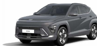
Ecotronic Gray Pearl Perleťová Kombinace dostupná také s černým lakováním střechy Cena: 17 900 Kč