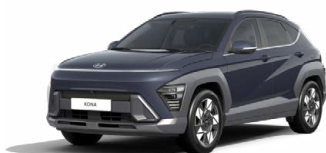
Denim Blue Pearl Perleťová Kombinace dostupná také s černým lakováním střechy Cena: 17 900 Kč