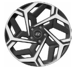
Unikátní N Line 18" kola z lehké slitiny