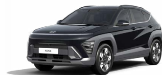
Abyss Black Pearl Perleťová Cena: 17 900 Kč