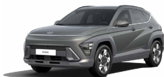
Amazon Gray Metalická Kombinace dostupná také s černým lakováním střechy Cena: 17 900 Kč