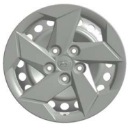
16" ocelová kola s celoplošnými kryty