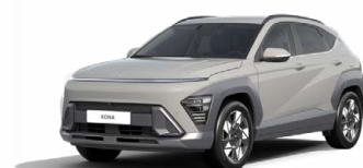
Quantum Grey Pearl Metalická Kombinace dostupná také s černým lakováním střechy Cena: 17 900 Kč