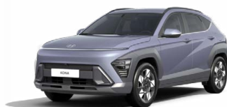
Meta Blue Pearl Perleťová Kombinace dostupná také s černým lakováním střechy Cena: 17 900 Kč