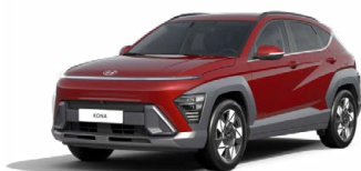
Vulcanic Red Pearl Metalická Kombinace dostupná také s černým lakováním střechy Cena: 17 900 Kč