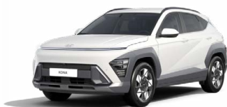
Atlas White Pastelová Kombinace dostupná také s černým lakováním střechy Cena: 9 900 Kč