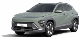
Mirage Green Pastelová Kombinace dostupná také s černým lakováním střechy Cena: 0 Kč