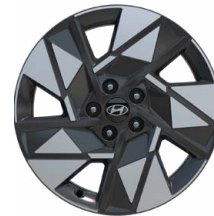
18" kola z lehké slitiny